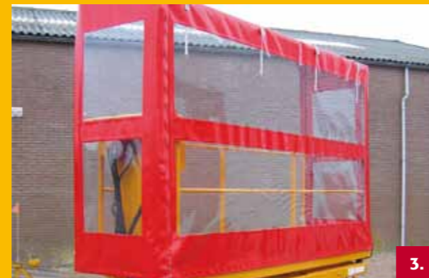
Huif | Canopy | Plane | Dais