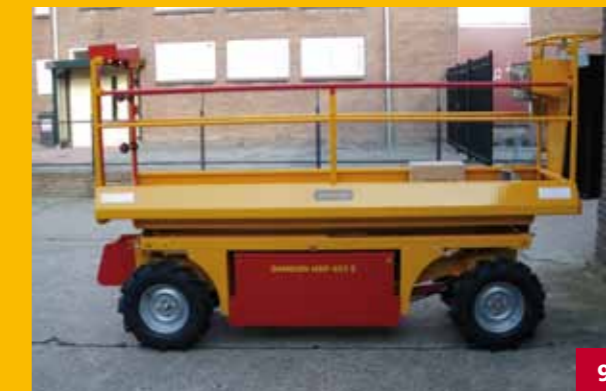
Verlengd platform | Lengthened platform Verlängerte Plattform | Plateforme allongée