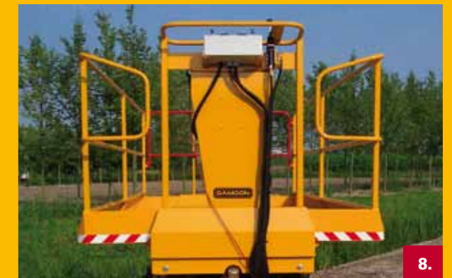
Breedteverstelling | Width adjustment Breiteverstellung | Ajustement de la largeur