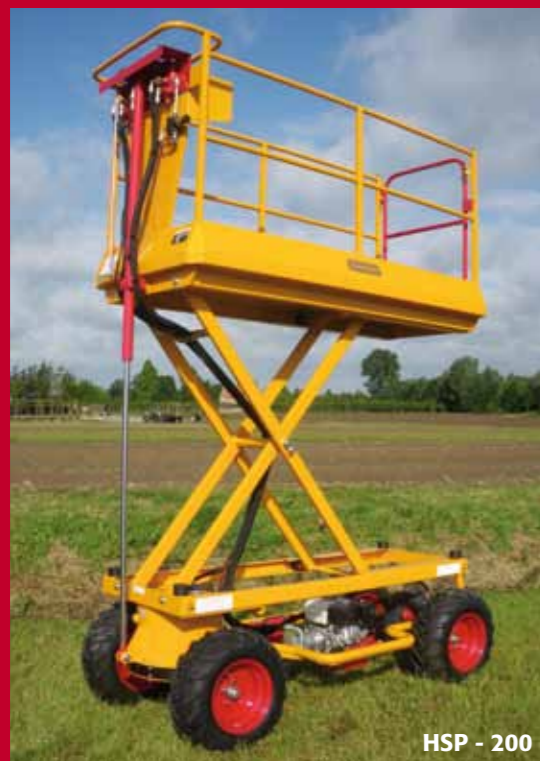
HSP - 200