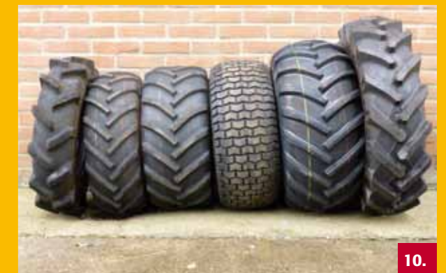
Verschillende banden | Several tyres Verschiedene Reifen | Plusieurs types de pneus