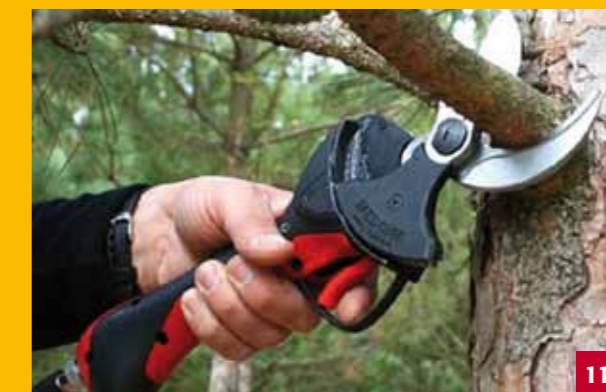
Electrocoup F3010 | Electrocoupe F3010 Electrocoup F3010 | Electrocoupe F3010