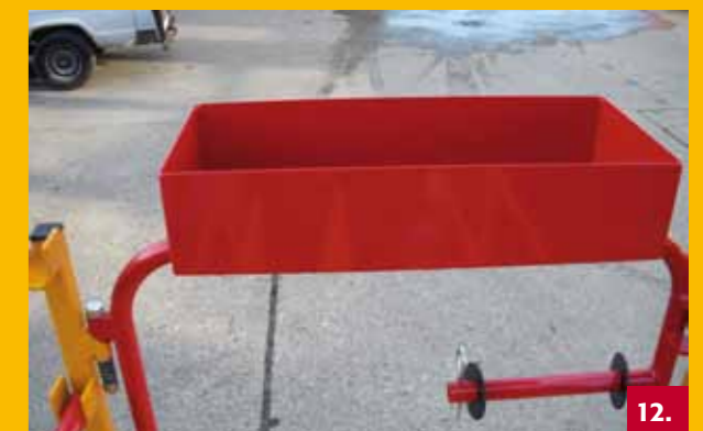
Extra gereedschapsbak | Extra tool box | Zusätzlicher Werkzeugkasten | Boite à outils supplémentaire