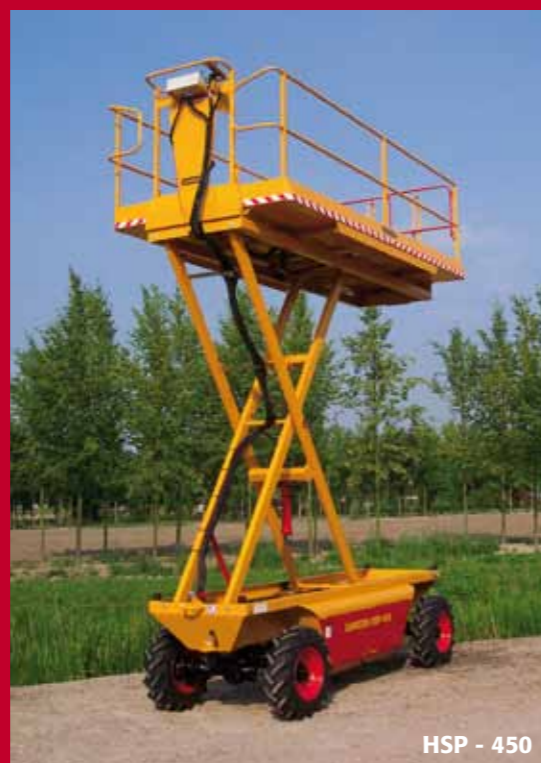
HSP - 450