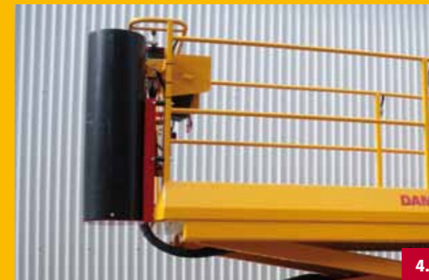
Tonkinstokhouder | Bamboo cane cask Bambus Behälter | Etuil pour tuteur de bambous