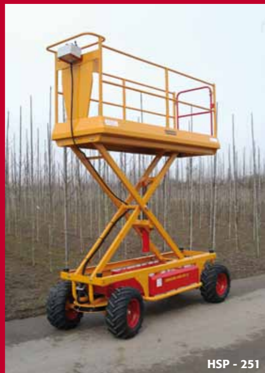
HSP - 251