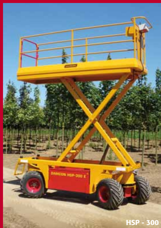
HSP - 300