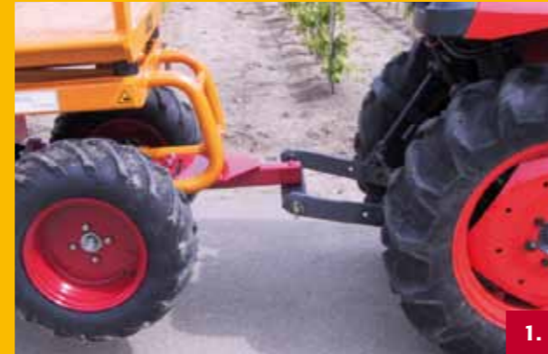
Trekhaak | Tow bar Zughaken | Barre de remorquage