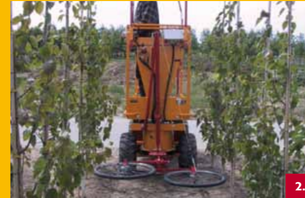
Automatische besturing | Automatic steering Automatische Lenkung | Pilote automatique