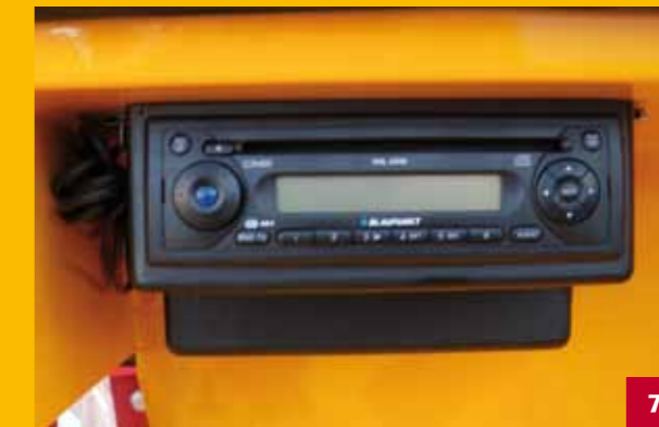
Radio | Radio | Radio | Radio