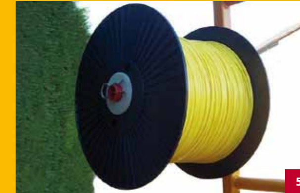
Buisrolhouder | Binding material support Bindematerial Behälter | Support pour enrouleur