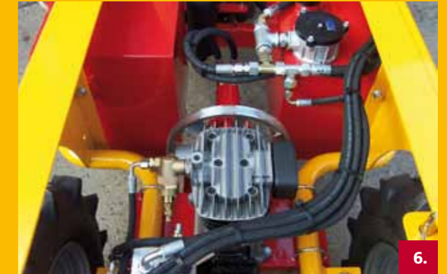
Compressor | Compressor Kompressor | Compresseur